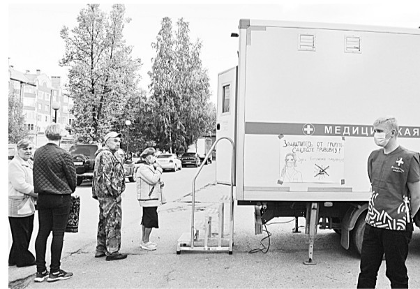
Проводить прививочную кампанию работникам поликлиники помогают волонтеры-медики

Прививочная кампания продлится до конца октября. Для вакцинации в поликлиническом отделении необходимо обращаться в каб. № 37, при себе иметь амбулаторную карту и СНИЛС. Временно кабинет работает до 15.30. По организации прививочной работы на предприятиях обращаться по телефону 2-30-35 или в каб. № 39.