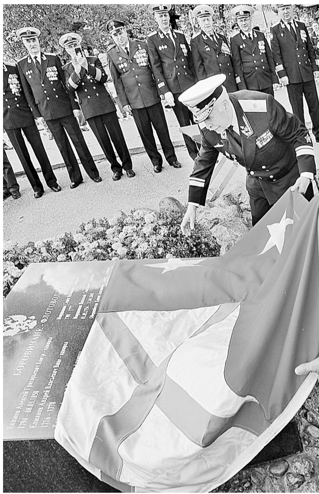
Торжественное открытие обелиска